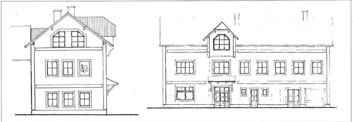
Die vorgesehene Fassadenansicht des Amtshauses in den Farben Sandstein/Weiß

Erscheinungsort Maria Anzbach Nr. 83 Juni 1992