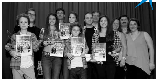
Die ausgezeichneten Supertalente aus Maria Anzbach